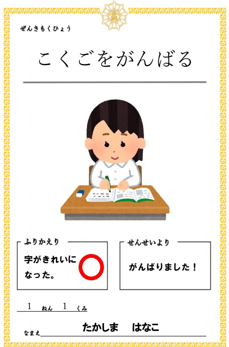
<本校の「キャリア・パスポート」の書式>