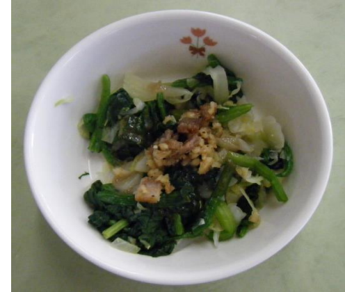
おんやさい (ぶろっこりー)