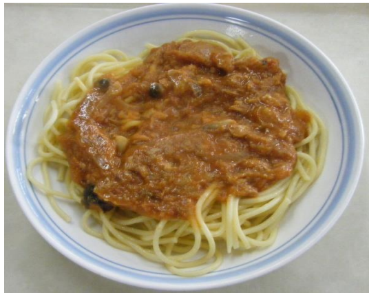
つなとまとすぱげてい