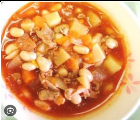
こーるすろーさらだ