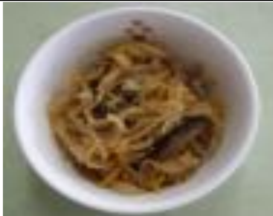
きりぼしだいこん