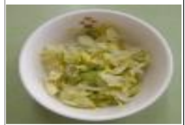
ふれんちさらだ (ぱいん)