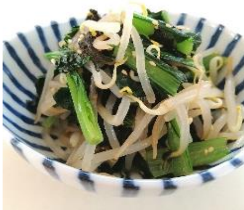
やさいのいそあえ