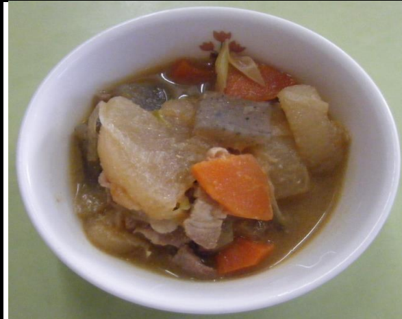
だいこんとぶたにくのみそに