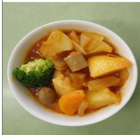
じゃがいもとやさいのとまとは