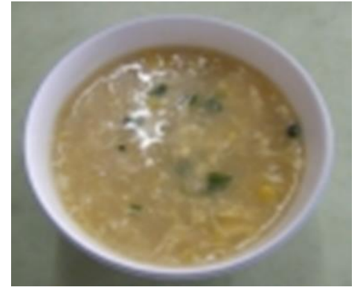
ちゅうかふうこーんすーぷ