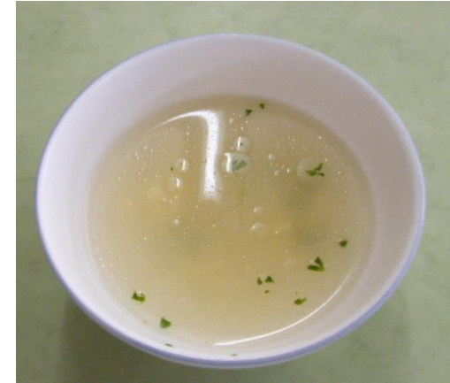
たまごとちーずのすーぷ