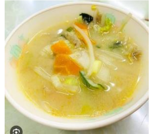
やさいのかれーすーぷ