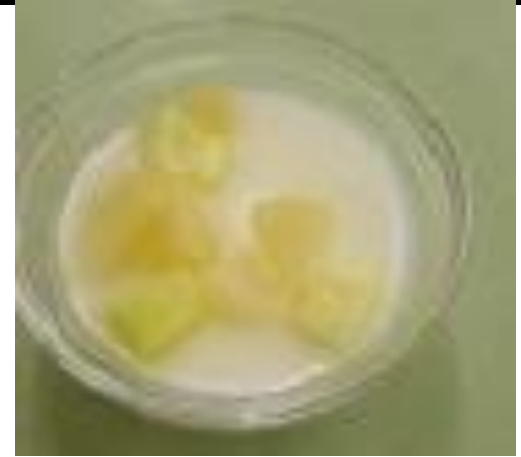
ふる一つみるくかん