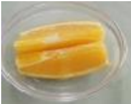
くだもの (ねーぶる)