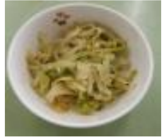
やさいのごますあえ