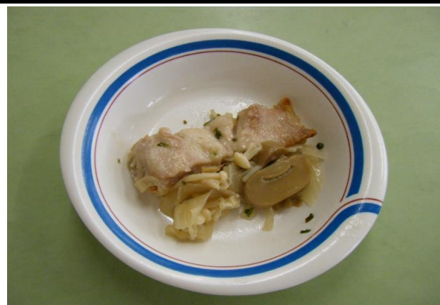
あげどりねぎそーす