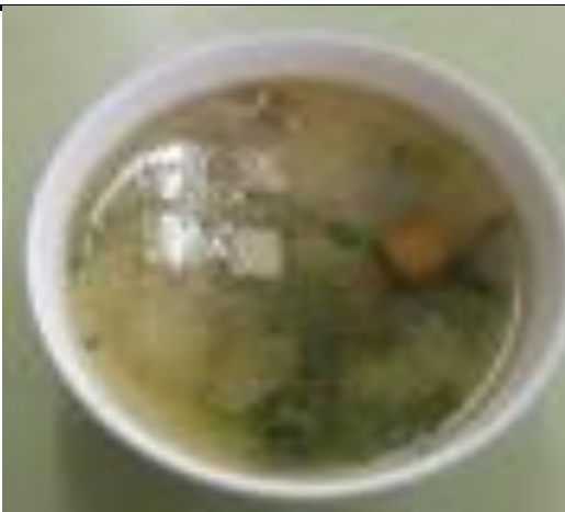
かきぎりやさいのすーぷ