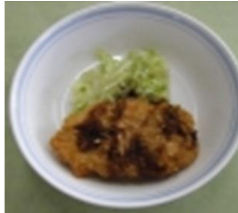
さけのくりーおそーす