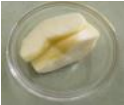
やさいのいそあえ