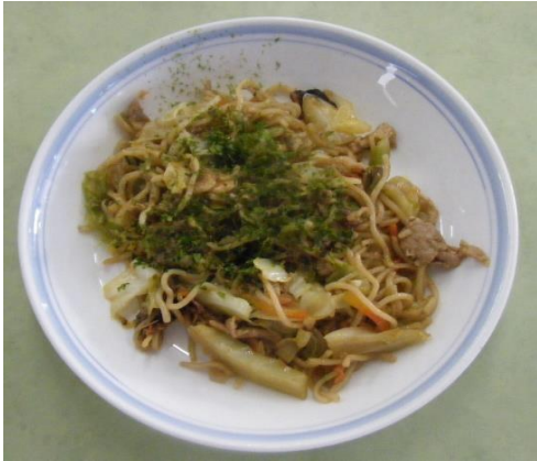
あんかけやきそば