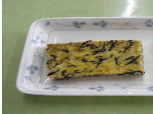
ごもくたまごやき