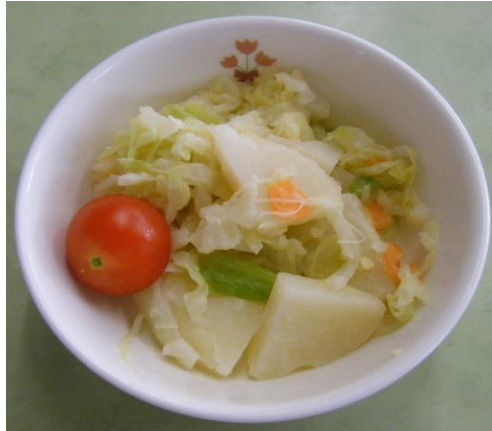
おにおんどれしんぐさらだ