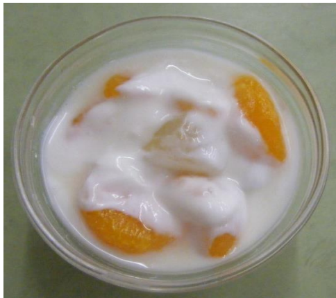
あろえよーぐると